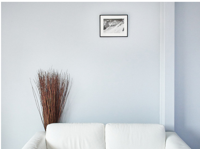
Tirage 20x30cm Cadre aluminium noir 30x45cm