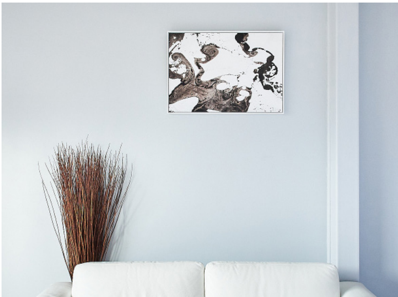
Tirage 50x75cm Caisse américaine bois blanc