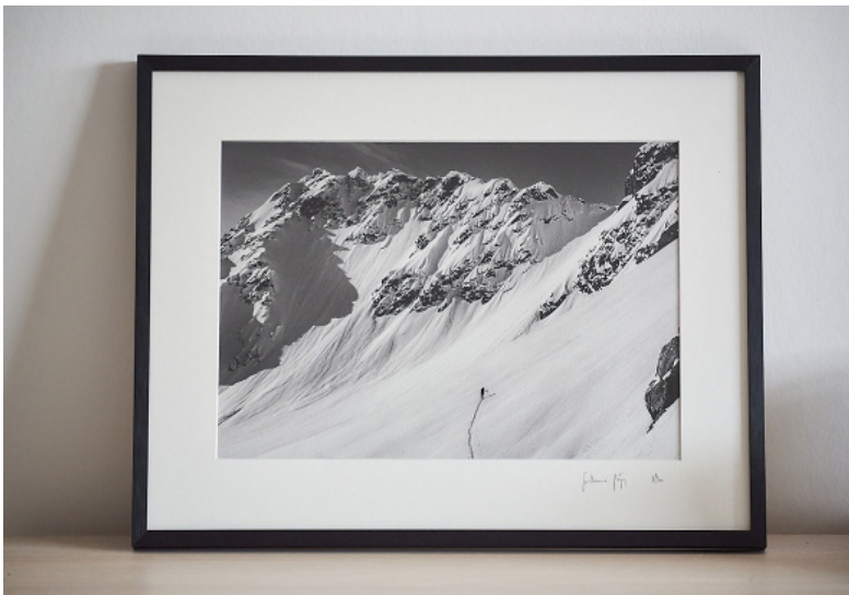
Tirage 20x30cm Cadre aluminium noir 30x45cm